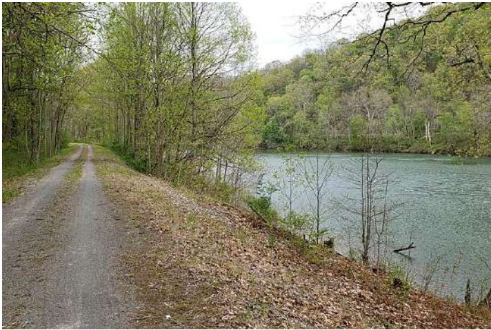
Figure 3: Trilha

Em anexo uma série de imagens de como é uma iniciativa semelhante nos EUA chamada de Mon River Trails Conservancy localizada nos estados do West Virginia, e parte de uma iniciativa maior ( https://youtu.be/UmFtKY4hkww ) que seriam mais de 150 milhas de trilha, conectando 4 estados (NY, OH, PE, WV).