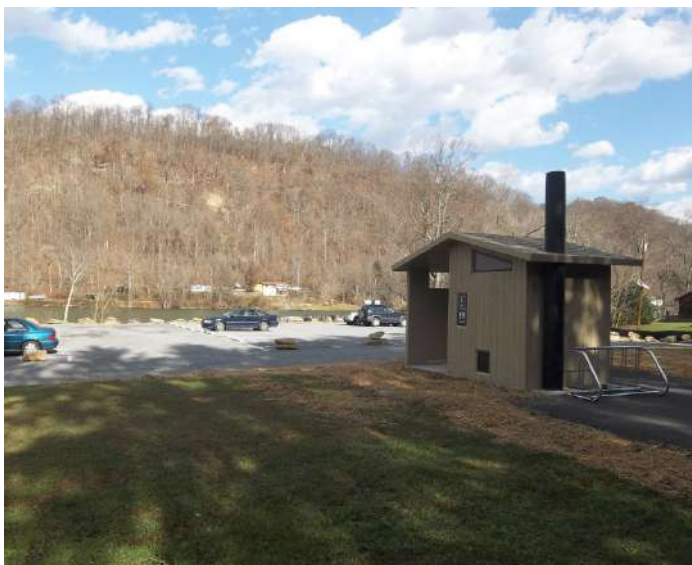
Figure 5: Acesso a trilha, com estacionamento de cascalho e banheiro público