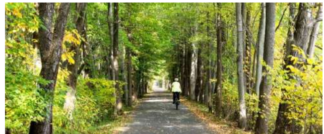
Figure 6: Trilha