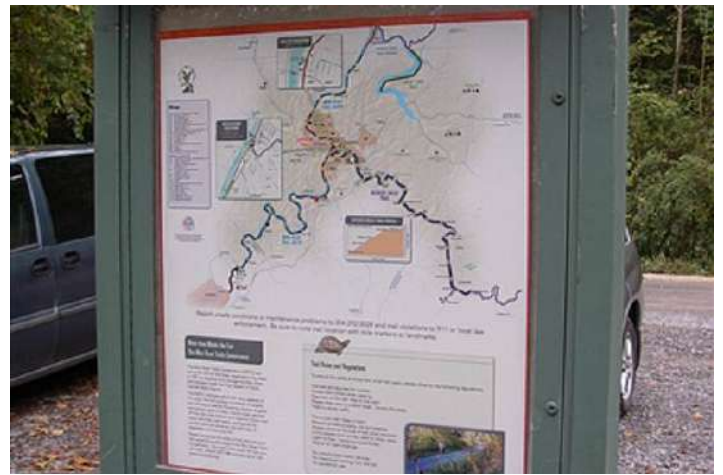
Figure 4: Mapa local da trilha