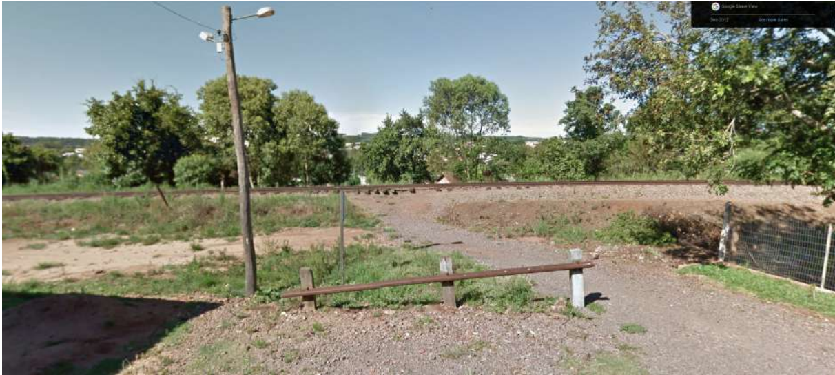
Figure 1:

Existem dezenas de kms de trilhos de trem obsoletos em muitas cidades no interior do RS. Em São Pedro do Sul por exemplo, esses trilhos ficam completamente abandonados, não sendo utilizados para transporte de carga. Segue imagens dos trilhos e mapa de onde . Além disso São Pedro do Sul, como muitas cidades pequenas do interior, não possui parques ou locais públicos ara lazer e pratica de exercícos. Não existem lugares para correr, andar de bicicleta, passear com animais, etc.